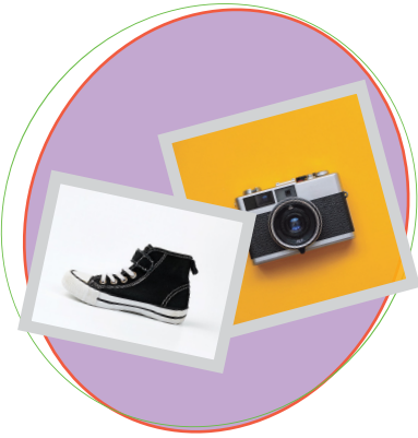
انٹرنیٹ پر تصویریں تلاش کریں