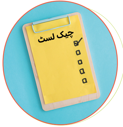
چیک لسٹس (فہرستیں) بنائیں