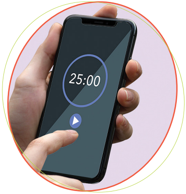
فون پر دستیاب ایپس استعمال کریں جیسے ٹائمر، ڈائریاں