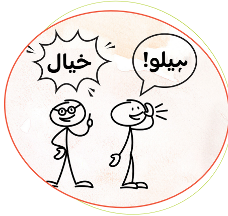
تصویری کتاب کا متن بنائیں: ساتھ ساتھ ڈرائنگ کرتے جائیں اور کہانی سناتے جائیں، سادہ جسمانی خاکے بنائیں اور انکی باتیں بلبلوں میں لکھیں