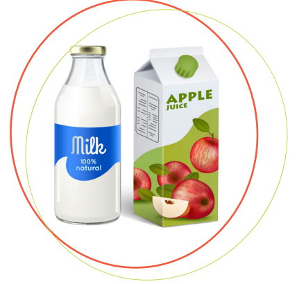
تصویروں کے ساتھ الفاظ لگائیں اور اپنے بچے کو انتخاب کرنے کی ترغیب دیں