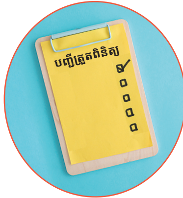
ធ្វើបញ្ជីត្រួតពិនិត្យ