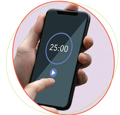
កម្មវិធី apps នៅលើទូរសព្ទ ឧទាហរណ៍ កម្មវិធីកំណត់ម៉ោង កម្មវិធីកំណត់ហេតុប្រចាំថ្ងៃ