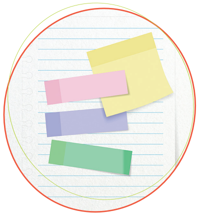
ដាក់សញ្ញាពណ៌ទម្លាប់ និងការណែនាំ