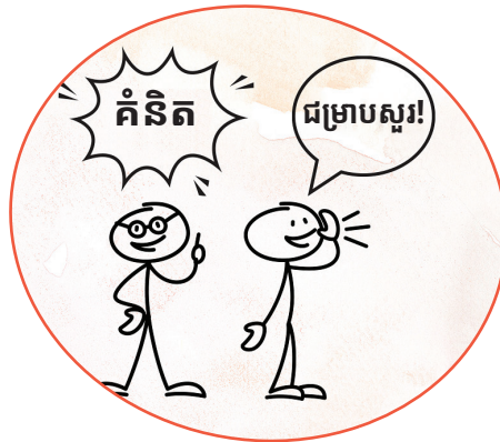
បង្កើតសៀវភៅរឿងក្មេងៗសរសេរ ដោយដៃ គួរ ហើយនិយាយរឿង នៅពេលអ្នកអានជាមួយគ្នាដោយ ប្រើគំនូរប្រភេទសាមញ្ញៗ (stick figures) និងរូបពុះនិយាយ