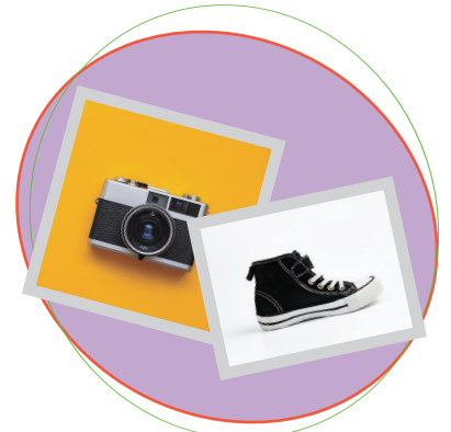
ស្វែងរកប្រភេទនៅលើ អ៊ីនធឺណិត