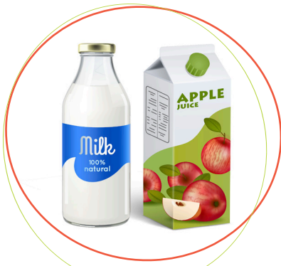
ដាក់ពាក្យជាមួយប្រភេទ ហើយលើកទឹកចិត្តកូនរបស់អ្នក ឱ្យធ្វើការជ្រើសរើស