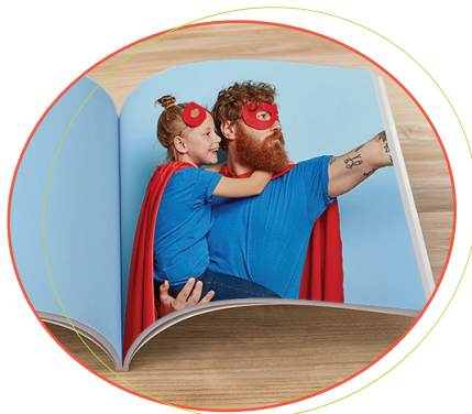
រឿងសង្គម - បង្កើតរឿងមួយដោយប្រើកូនរបស់អ្នក ឬគូអង្គសំណាញ់របស់កូនអ្នក ដើម្បីរៀបចំកូនរបស់អ្នកសម្រាប់សកម្មភាព ឬផែនការថ្មីមួយ។

ប្រសិនបើអ្នកព្រួយបារម្ភអំពីការអភិវឌ្ឍន៍របស់កូនអ្នក សូមទៅជួបវេជ្ជបណ្ឌិត ឬអ្នកមានវិជ្ជាជីវៈដែលជួយកូនរបស់អ្នក។ វាជាការប្រសើរក្នុងការនិយាយជាមួយនរណាម្នាក់ ជាជាង 'រង់ចាំមើល'។