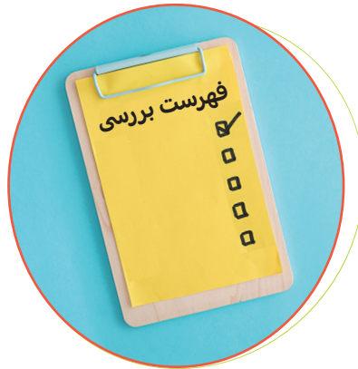
فهرست بررسی بسازید