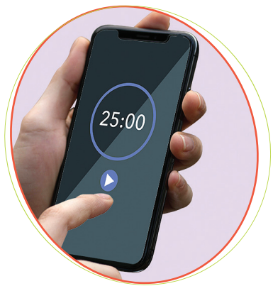
برنامه های موجود در تلفون ها، مانند تایمر، خاطرات