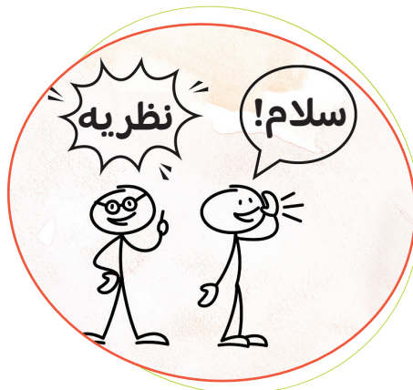
یک فیلمنامه کتاب مصور بسازید: با استفاده از شکل های چوبی و حباب های گفتاری، داستان را در حین حرکت بکنید و بگویید