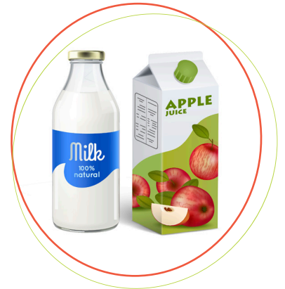
کلمات را همراه با تصویر قرار دهید و طفل تان را تشویق کنید که انتخاب کند