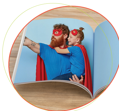
داستان های اجتماعی را - بسازید که با استفاده از طفل تان یا شخصیت مورد علاقه طفل تان، طفل تان را بلدی یک فعالیت یا برنامه جدید آماده کنید.

اگر شمو نگران رشد طفل تان هستید، به دوکتور یا متخصصی که به کودک تان کمک موکند مراجعه کنید. صحبت کردن قنجه کسی بهتر از « صبر کردو و دیدو » است.